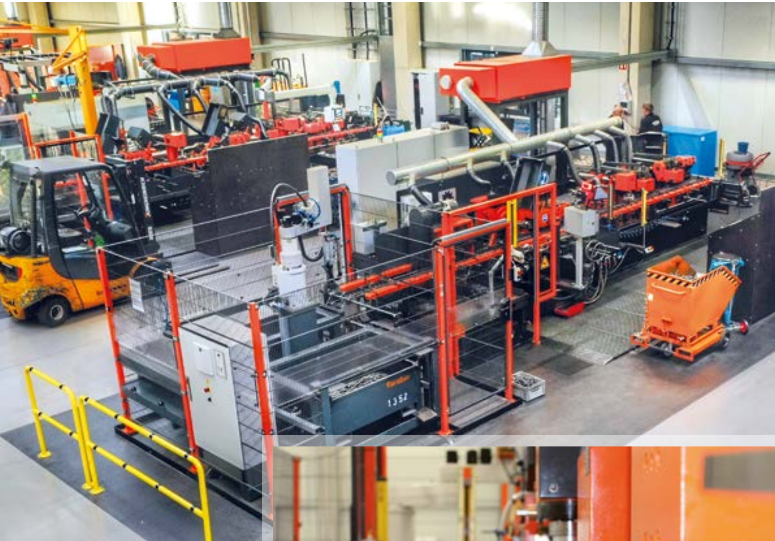
Formowanie na zimno